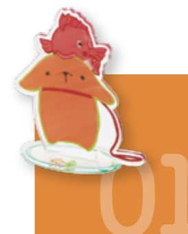
アクリル スタンド