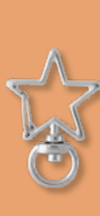
チャームフック 星型