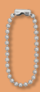
ボールチェーン BC 23/10