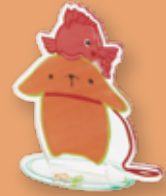
アクリル スタンド