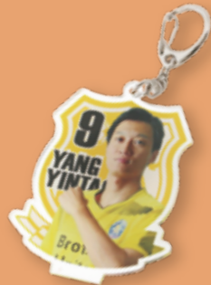
キーホルダー 装着イメージ