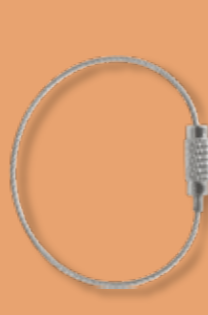
ワイヤーキーホルダー Y-10/12

メッキや形のバリエーションも豊富に取り揃えております。ご希望の色・形状がありましたらお問い合わせください。