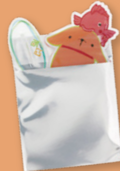
・アルミ蒸着袋入り