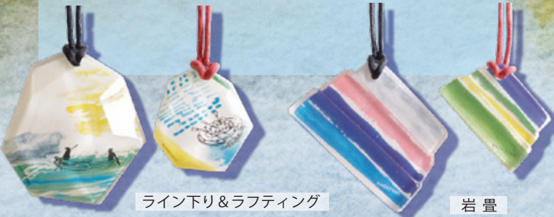
ライン下り&ラフティング